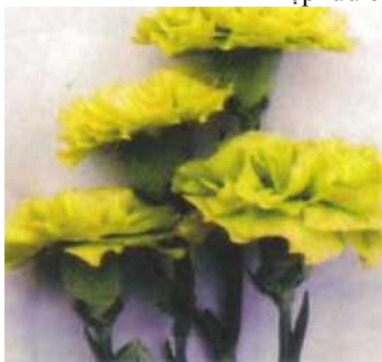
Giống Cẩm chướng TD15

Giấy phép số' 22/990 XB-QLXB do Cục Xuất bản cấp ngày 23/6/2005. In xong và nộp lưu chiểu Quy IV/2005.