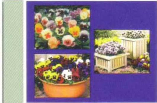
Cắm Chướng TD11